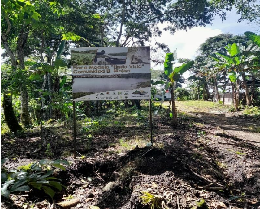
Figura a. Entrada a Finca Modelo Linda Vista Comunidad El Mojón