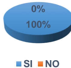
Grafico No 9

¿Considera que los ingresos de las ventas se hagan inmediatos y correctos en la venta de plántulas?