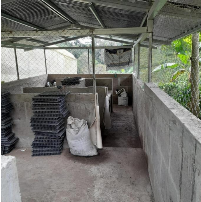
Figura a. Área de elaboración de sustrato convencional.