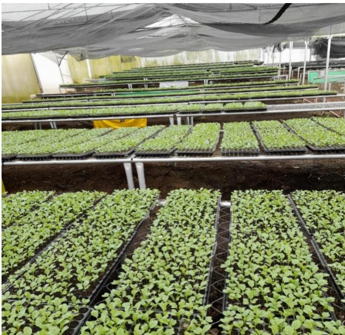
Figura b. Interior de invernadero, Área de semillero