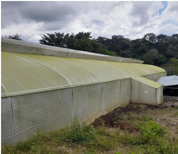
Figura b. Estructura del centro de invernadero, finca Linda Vista.