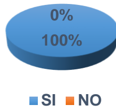
Grafico No 8

¿Considera que los procedimientos utilizados en registros contables determinan actividades de control que aseguran la integridad de los registros?